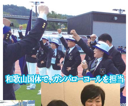
和歌山国体で、ガンパローヨールを担当