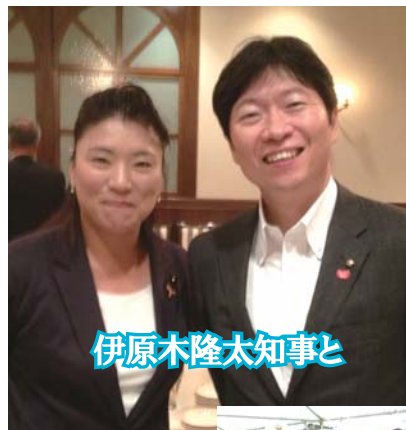
伊原木隆太知事と