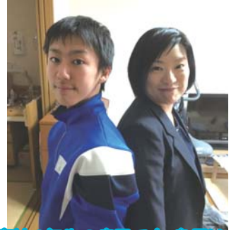
高校2年生の息子です。身長は抜かれましたが体重は私の圧勝!!