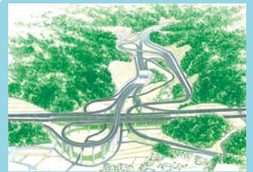
美作岡山道瀬戸ジャンクションインター整備が進んでいます