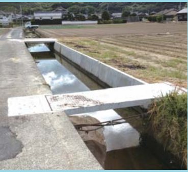
久々井西浜水路改良工事中