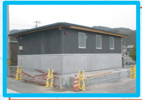
犬島行のフェリー乗り場、朝日漁港(西宝伝)トイレ整備工事