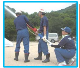
7月 瀬戸毘沙門天王夏祭り花火の前の放水訓練。