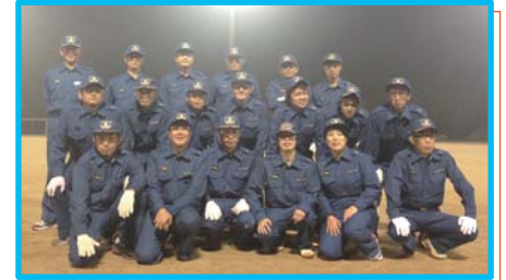
5月 岡山市消防団東第4方面隊の教養訓練に参加。