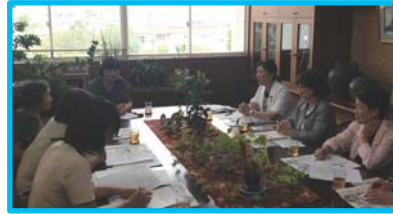
9月 農業委員活動の一環として、太伯小学校の学校給食について研修。